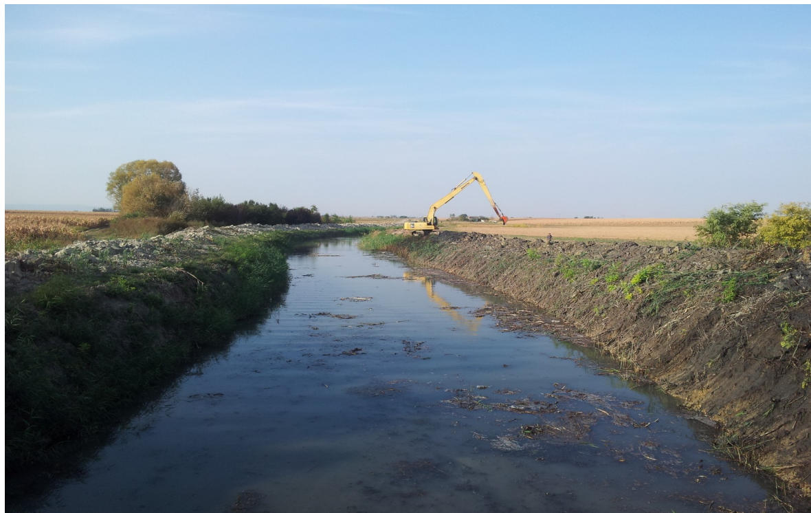
Канал J-334 код фазанерије

Осматрање кретања нивоа подземних вода се врши у К.О. Темерин на пет пијезометра и то четири у Темерину и један у Бачком Јарку. Ниво подземних вода варира од мин. 0,9 м до мах. 3,5 м.