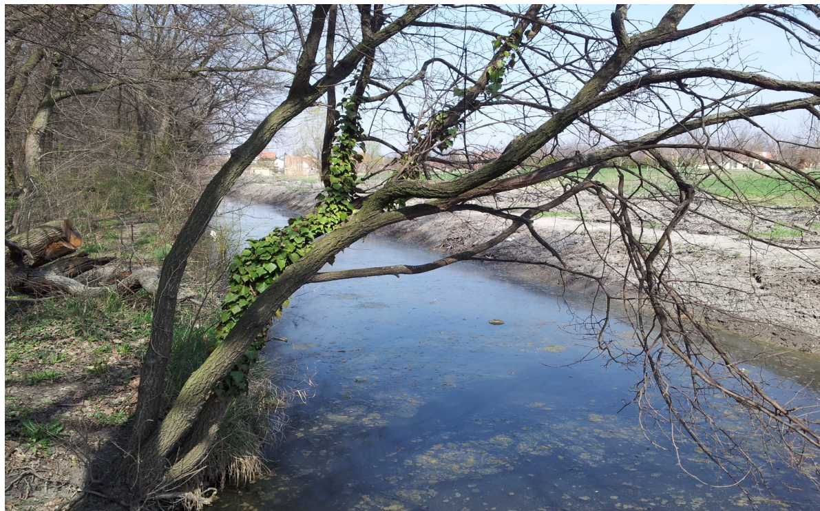
Канал J-152 поред парка у Темерину

Одводњавање терена врши се путем мелиоративних канала вишег и нижег реда, као и тзв. комуналним – атмосферским каналима у насељеним местима. Коначни реципијент за све канале детаљне каналске мреже је канал Јегричка. Целокупно одводњавање свих канала се врши гравитационо, без присуства црпних станица на терену. Најзначајнији мелиорациони канали у систему за одводњавање Темерин су: J-152 стационаже у Општини Темерин од 8+010 до 18+640, J-334 од 0+000 до 12+480 и канал J-362 од 0+000 до 7+500км.