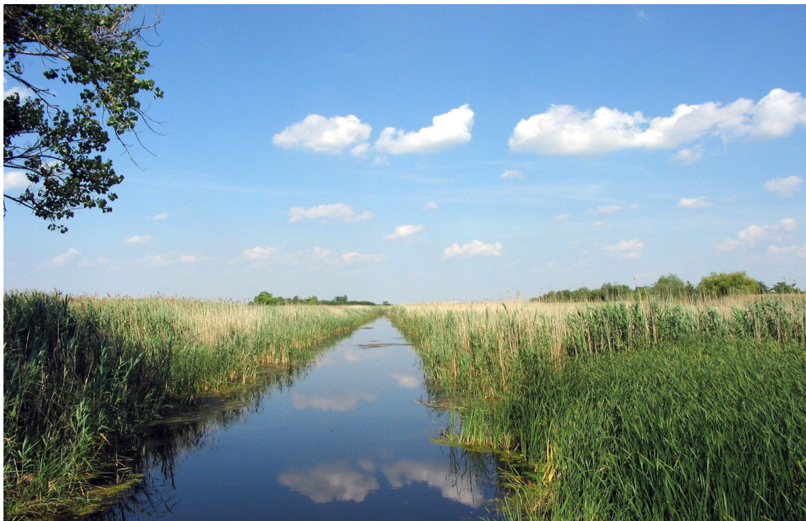
Водоток Јегричка код моста на путу за Бечеј

Водоток Јегричка је дужине 64 km и представља највећу речицу на Бачкој јужној лесној тераси. Некада најдужа аутохтона Војвођанска река, нема класичан извор и представља систем повезаних канала кроз које вода отиче до свог ушћа у реку Тису преко црпне странице Жабалџ(Црна ћуприја).